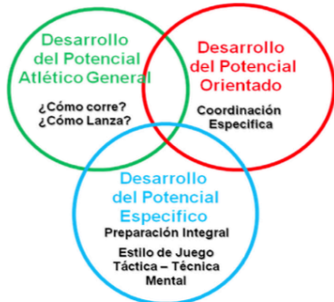
Figura 1. Implementación del modelo en la Escuela de tenis.