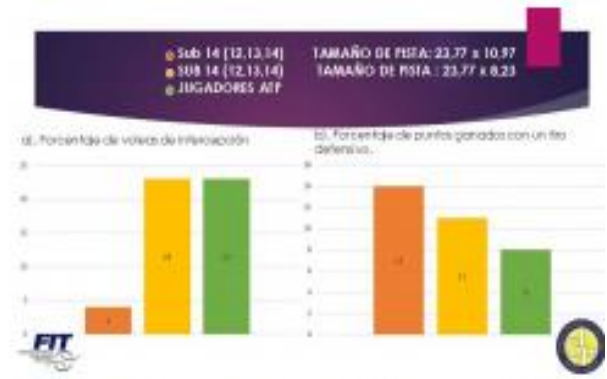
Figura 4a y 4b. Porcentaje de voleas cruzándose y porcentaje de puntos ganados con un tiro defensivo.

Los datos estadísticos de la Figura 3 confirman las tendencias anteriores: las elecciones tácticas y los patrones de juego se tornan más ofensivos, se acercan a los de los profesionales cuando se juega el dobles en una cancha de ancho reducido.