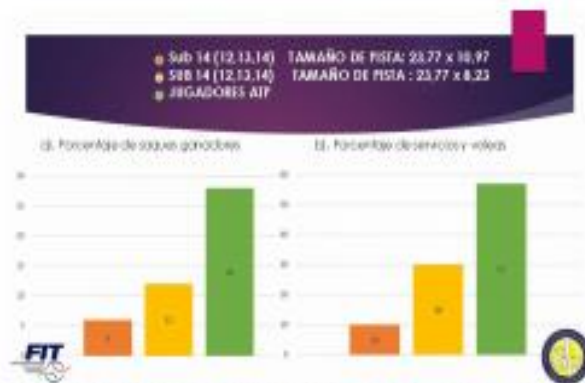
Figura 2a y 2b. Porcentaje de servicios ganadores y porcentaje de servicios y voleas.

(12%). No obstante, los datos de los jugadores profesionales se mantienen muy alejados, con 28%, debido al mayor desarrollo físico de los jugadores de este nivel.