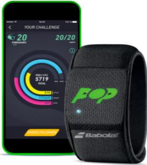
Figure 1. Bracelet Babolat Pop.

droits et revers pour les cinq jours. Des corrélations entre l'âge et le nombre de coups ont aussi été calculées. Finalement, les résultats des différents types de coups dans une même journée ont été comparés en utilisant le test t de Student pour échantillons appariés avec un seuil de significativité p \leq 0.05 . Toutes les analyses statistiques ont été réalisées en utilisant le logiciel SPSS 11.0 (SPSS, Inc., Chicago, IL, USA).