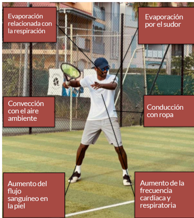
Figura 1. Mecanismos de eliminación del calor en los tenistas

Las disfunciones fisiológicas (por ejemplo, una frecuencia cardíaca y una temperatura central muy elevadas), vinculadas a las dificultades para disipar el calor, pueden reducir el rendimiento deportivo (Hue, 2011; Périard y Bergeron, 2014), promover la deshidratación en los tenistas (Kovacs, 2006) y también son susceptibles de amenazar la salud de los deportistas en los entrenamientos o durante las competiciones (Bergeron et al., 2014; Léon y Bouchama, 2015). Además, es importante señalar que jugar en condiciones de calor también puede generar limitaciones psicológicas y cognitivas (por ejemplo, aumento de los efectos negativos, limitación de los recursos atencionales) que pueden promover la aparición temprana de la fatiga, amplificar el esfuerzo percibido, aumentar el malestar y disminuir la motivación de los deportistas (Périard et al., 2014; Robin et al., en prensa). Para limitar los efectos nocivos del calor, los tenistas pueden utilizar diferentes estrategias de enfriamiento: enfriamiento interno (por ejemplo, ingestión de bebidas frías o hielo picado) y externo (por ejemplo, bolsas de hielo, toalla fría, agua fría en spray) o aclimatación (Robin et al., 2021) y deben asegurarse de mantener un buen estado de hidratación y limitar la deshidratación mediante el uso de bebidas adecuadas para el ejercicio y la recuperación.